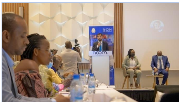
Atelier de validation de la feuille de route