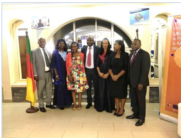
Mission de partage d'expériences sur l'engagement de la diaspora pour le système de santé au Cameroun