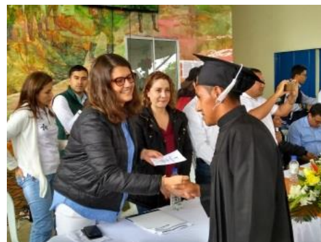
Ceremonia de Graduación Entorno de Aguacate Hass

En el entorno de Aguacate Hass, se tuvo la participación de 35 personas pertenecientes a la comunidad indígena Nasa. La fase lectiva de formación se desarrolló en el Sena Norte de Popayán y la fase práctica la desarrollaron en el ETCR de Caldon. Los participantes de este entorno recibieron su certificado de formación por parte del SENA el 14 de diciembre de 2018, durante una ceremonia de graduación que contó con la participación de la Embajada de Francia, entidades territoriales, dirigentes civiles e indígenas y socios del proyecto. Con el fin de consolidar la estación de aprendizaje el entorno recibió apoyo por parte de un instructor hasta el 28 de febrero de 2019.