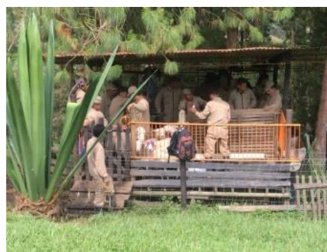
Actividades en el Entorno de Ganadería y Piscicultura del ETCR de Carrizal