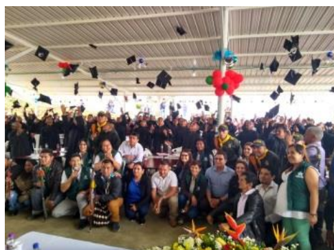
Ceremonia de Graduación Entorno de piscicultura de Caldono