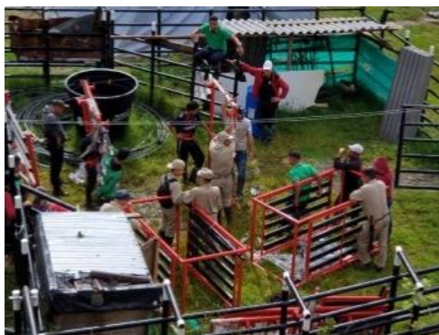
Entorno de Ganadería, Pequeños Rumiantes y Agroecología

Posterior a esta identificación se procedió a realizar las siguientes acciones para definir el inicio del proyecto y definir los parámetros de acción: