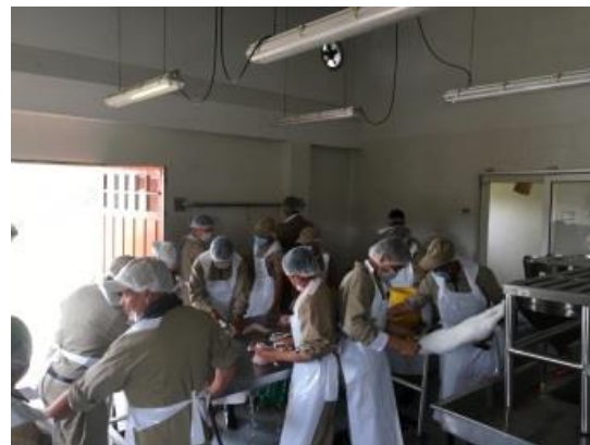
Entorno de Ganadería, Pequeños Rumiantes y Agroecología

En 2019, se realizó una evaluación interna con el objetivo de determinar la relevancia del proyecto frente a las expectativas productivas de las personas participantes e identificar las oportunidades para futuro apoyo; evaluar la eficacia del proyecto (de la formación brindada), incluyendo identificar los cambios (percibidos, positivos y negativos) que resultaron del proyecto; y finalmente Identificar recomendaciones para el futuro apoyo a los proyectos productivos y la formación técnica