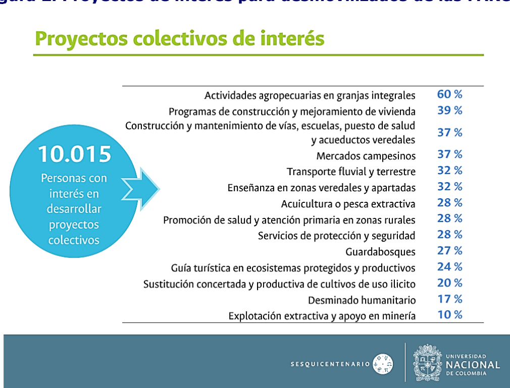
Figura 2. Proyectos de interés para desmovilizados de las FARC-EP