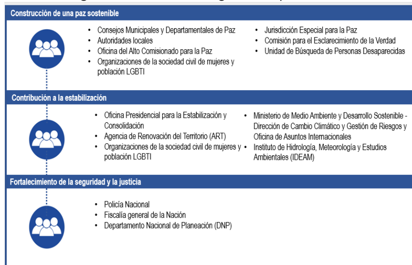
Imagen 1. Socios del Programa FIP por línea de acción